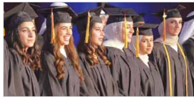
خريجو كلية الآداب والعلوم