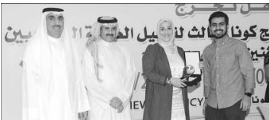
تكريم أحد المتدربين