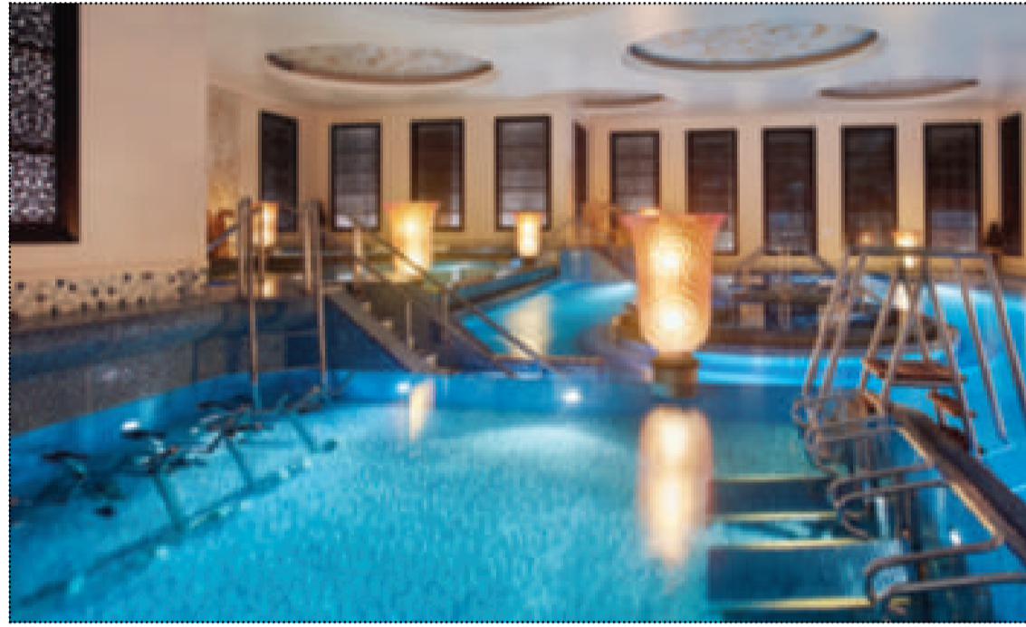
● منطقة ممارسة الرياضة المائية

«سبا أكواتونيك» في الثريا سيتي الكويت أعلن عن عرضه الجديد هذا الأسبوع «صمم الباقة المفضلة لديك». ليوم كامل من الاسترخاء والتدليل حيث يمكن الآن اختيار 3 جلسات للعلاج وليتم استخدامها في نفس اليوم.