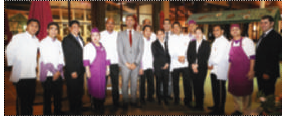
● صورة جماعية