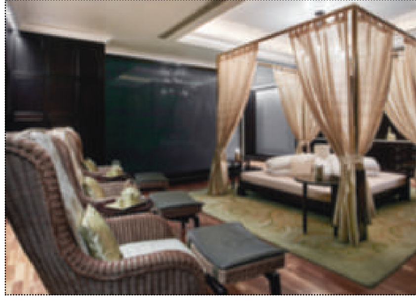
● غرف للاسترخاء