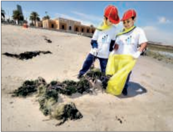
● طلاب مشاركون في الحملة المتنقلة الكبرى لتنظيف الشواطئ

تمكن طلاب في وزارة التربية مشاركون في الحملة المتنقلة الكبرى لتنظيف الشواطئ التي تقوم بها المبرة التطوعية البيئية من رفع شباك صيد مهمة من ساحل شرق المقابل للمستشفى الأميري في مدينة الكويت العاصمة. وقال مسؤول البرامج الثقافية بفريق الغوص الكويتي التابع للمبرة احمد الدمشي له: كونا، امس، إن الطلاب المشاركين في الحملة التطوعية تمكنوا بمساعدة الفريق من رفع شباك صيد مهمة من الساحل كانت تسبب ضررا للكانثات الساحلية والملاحة. وأضاف الدمشي ان طلاب وطالبات مدارس الكويت والمشاركين بالحملة قاموا بإدلاء الواجب التطوعي والبيئي من أجل الكويت من خلال مساهمتهم الفعالة في رفع المخلفات الضارة للبيئة البحرية والساحلية. وذكر ان البرنامج التوعوي للحملة حقق أهدافه الكبرى بشأن مشاركة الطلبة في خدمة