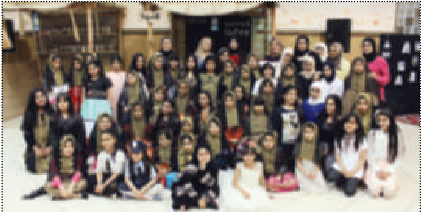
الطالبات أثناء عرض أعمال التريكو